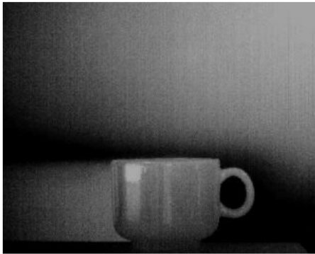
Sl. 2. Eksperiment, slika u trenutku t+1 sat

Radi detaljne analize šuma koji se javlja u termalnoj slici, i razlaganja tog šuma na šum koji se javlja usled fluktuacije scene i šum koji potiče od samog detektora, urađen je prethodno opisani eksperiment. Prvo je analizirana slika razlike tokom vremenskog intervala od jednog časa. Prikazaćemo sliku kada u šolji nema tečnosti, prikazanu na slici 2.