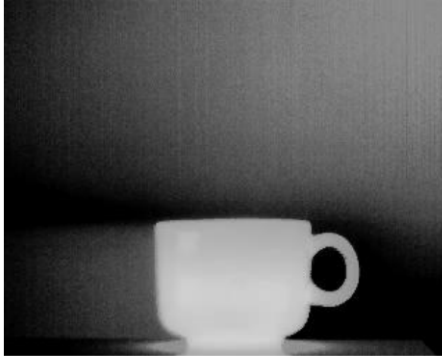
Sl. 5. Eksperiment, slika šolje sa usutom vrelom vodom